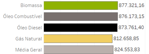
Gráfico 1 – Preço Médio por Combustível (R$/MW.ano)